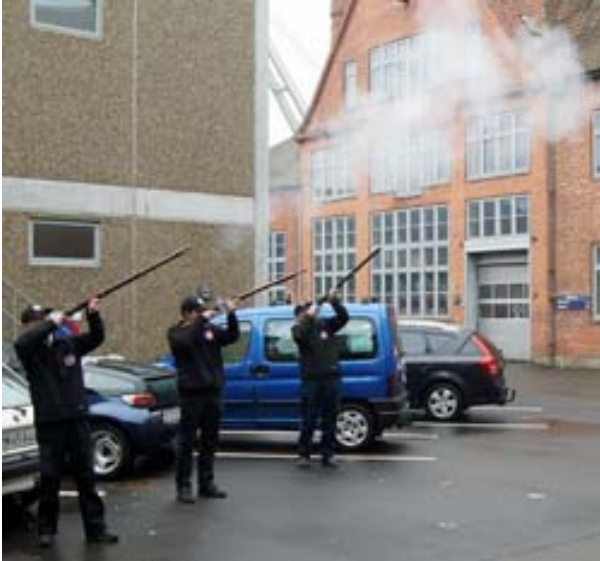
Sortkrudtsskytter skød højtideligheden i gang.

Stedet, hvor receptionen blev holdt, er kantinen fra det gamle værft, som ligger tæt på Apholmen, hvor den første skydebane lå. Den blev ødelagt under krigen, hvor tyskerne benyttede banen til træning og klubhuset som mål for artilleri.